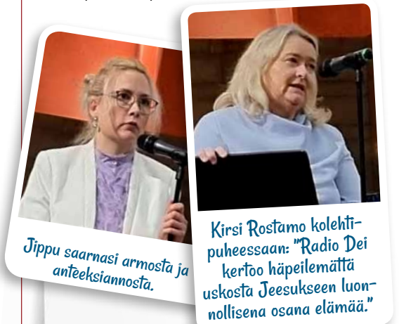
Jippu saarnasi armosta ja anteeksiannosta.

Radio Dein syntymäpäiviä juhliittiin Helsingin Tuomasmessussa 5.11. Lämmin kiitos kaikille messun toteuttajille sekä osallistujille niin radion ääressä kuin paikan päällä.